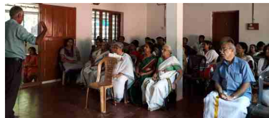
ആണ്ടൂർ ശാഖാ വാർഷികം