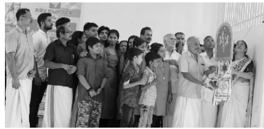
വൈക്കം ശാഖാ വാർഷികം