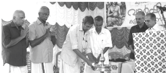
കുറവിലങ്ങാട് ശാഖാ വാർഷികം