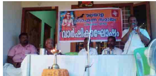
രാമപുരം ശാഖാ വാർഷികം