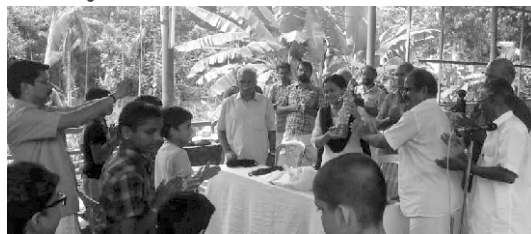
കോത്തല ശാഖാ വാർഷികം