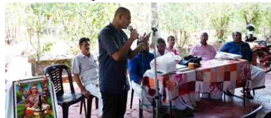
ചങ്ങനാശ്ശേരി ശാഖാ വാർഷികം