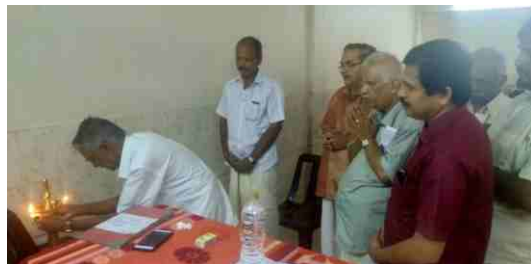
പാലാ ശാഖാ വാർഷികം